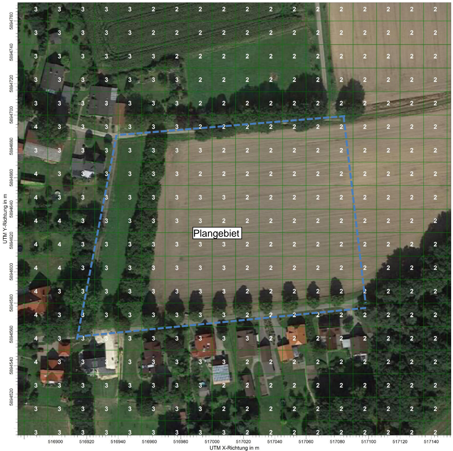
Abbildung 4: Belästigungsrelevante Kenngrößen im Bereich des Plangebietes in Prozent der Jahresstunden; Gesamtbelastung Hintergrundkarte © Google