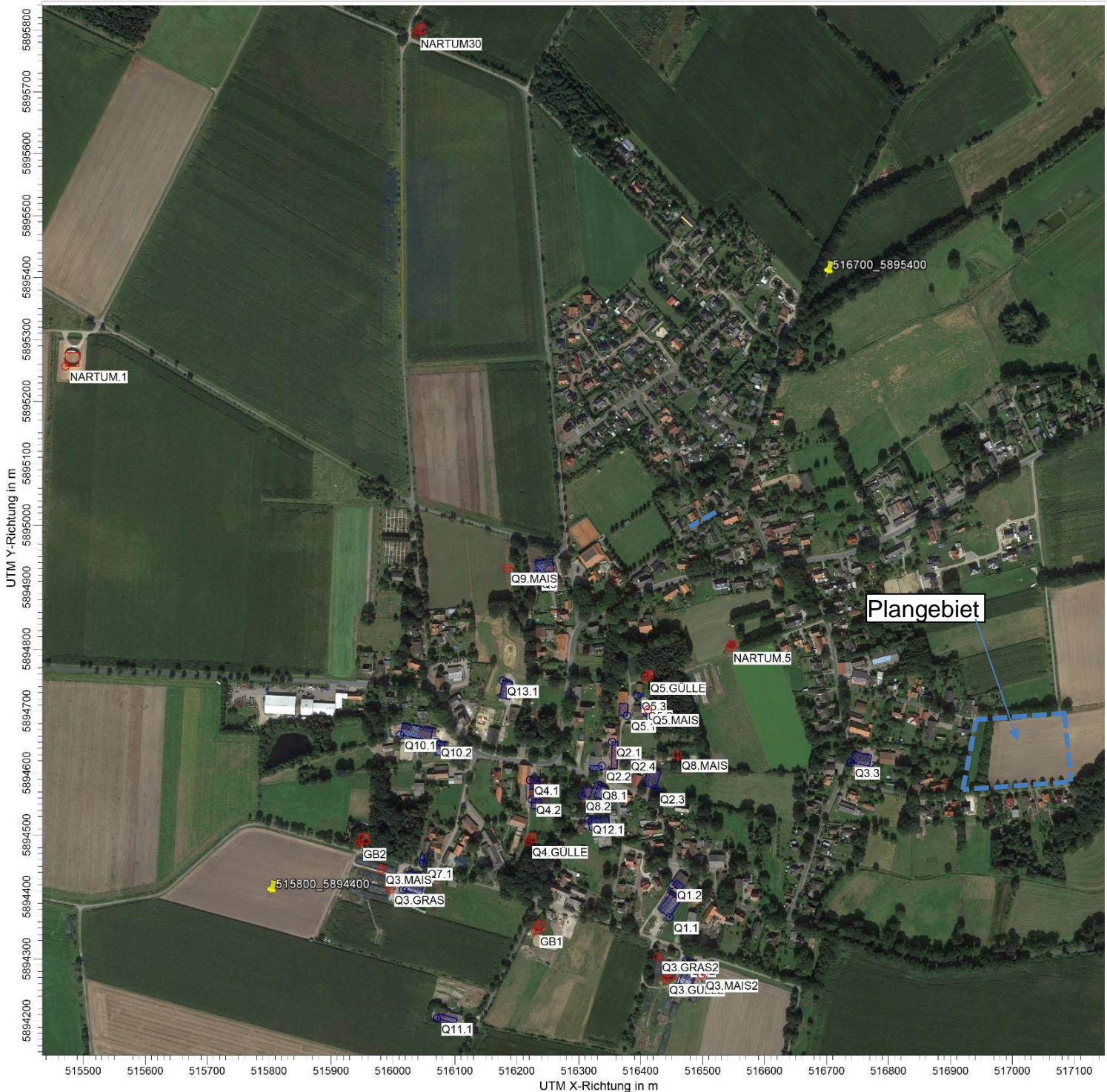
Abbildung 1: Lageplan Stallanlagen (Q1.1 bis Q13.1; nach Angaben der Samtgemeinde Zeven; NARTUM... Güllebehälter im Außenbereich) Plangebiet Hintergrundkarte.