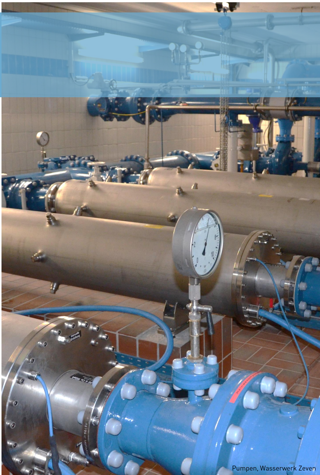
Pumpen, Wasserwerk Zeven