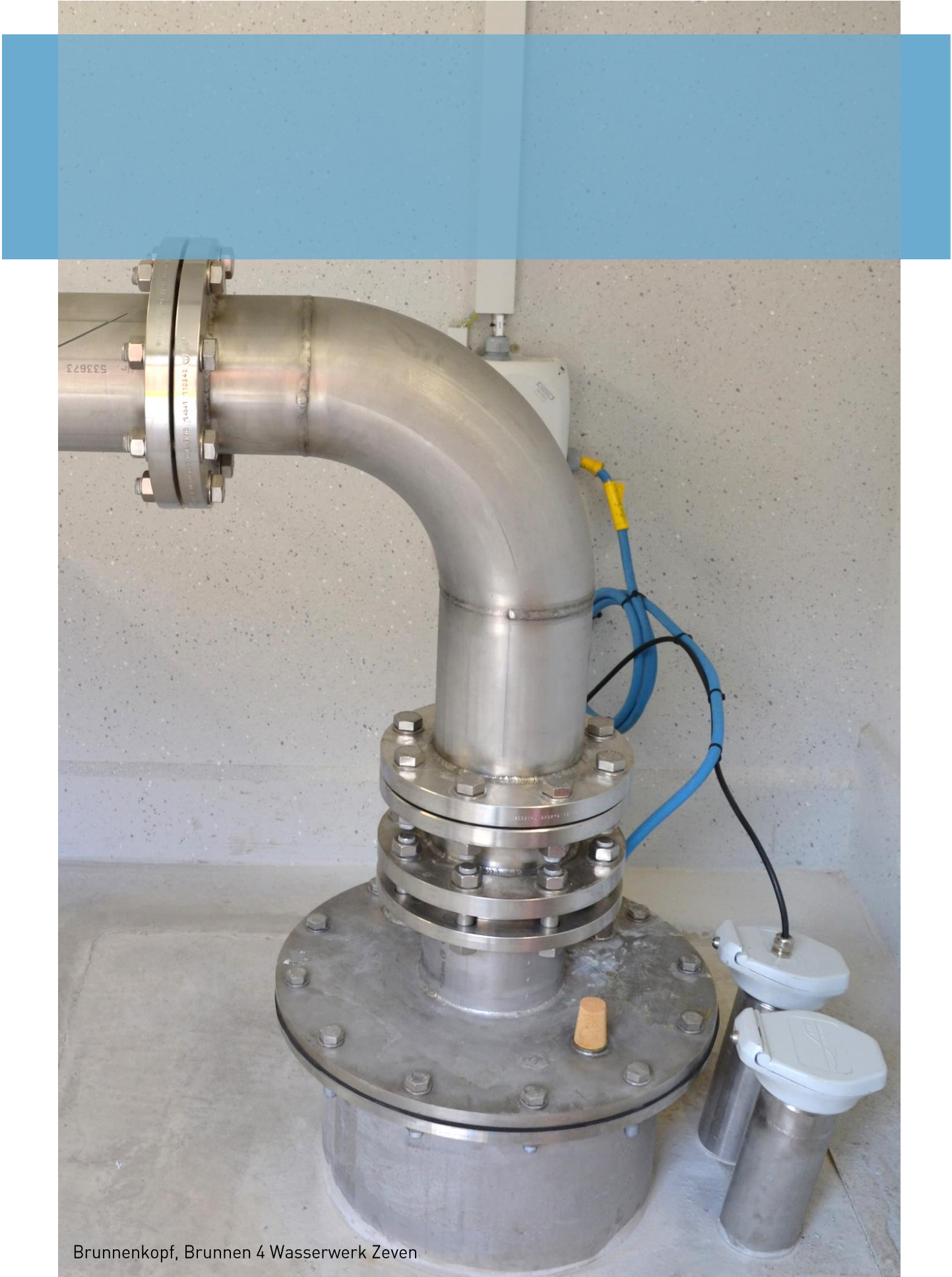
Brunnenkopf, Brunnen 4 Wasserwerk Zeven